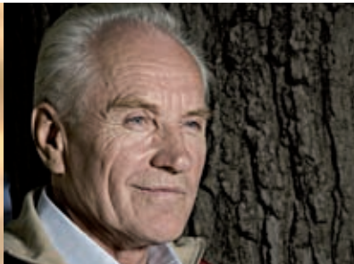
... auf meinem Lieblingsberg weilen