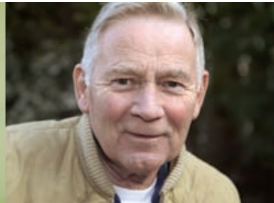
... zu Hause sein