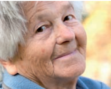
... in meinem Garten ruhen

Wir beraten Sie bei Ihnen zu Hause oder in unseren Lokalitäten. Ein Anruf genügt, um einen Besprechungstermin zu vereinbaren.